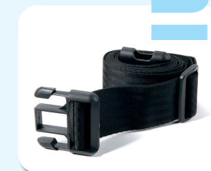
B20 - Cintura di sicurezza