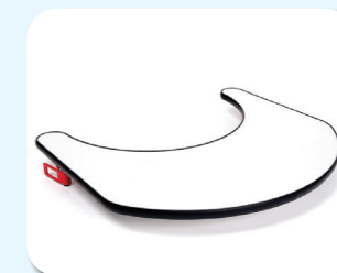
B12 - Tavolino

Gli scomparti possono essere facilmente rimossi grazie alla pratica cerniera.