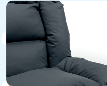
- Scomparto delle gambe -

Ogni scomparto è dotato di cuscini riempiti di microsfere che offrono un supporto ottimale al corpo e ai suoi contorni.