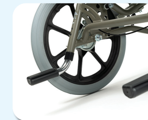
B77 - Sistema antiribaltamento