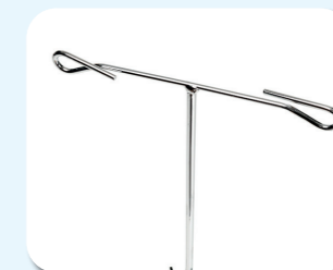
B52 - Asta porta flebo