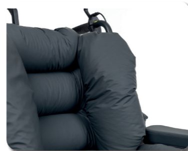
- Scomparto toracico -