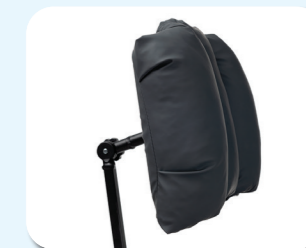
L58G - Poggiatesta comfort