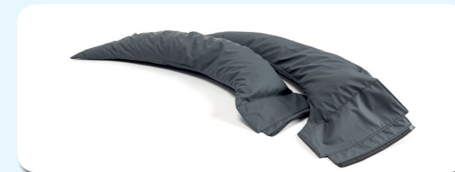
L71 - Braccioli granulari amovibili