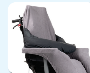
B54 - Panno/copertura