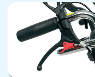
B74 - Freni a tamburo