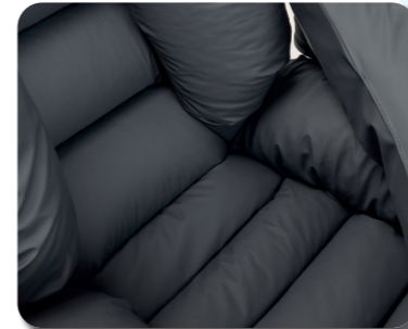
- Scomparto della seduta -