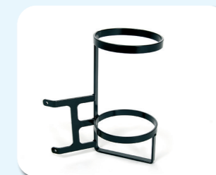
B83 - Portabombola