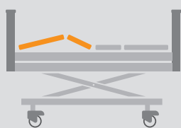
REGULACJA SEGMENTU NÓG